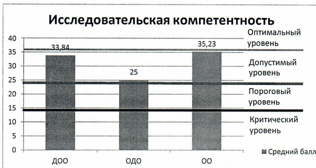
Рис.3 – распределение средних баллов по результатам оценки Исследовательской компетенции

При исследовании проектной компетенции применялся опросный лист, содержащий следующие вопросы: