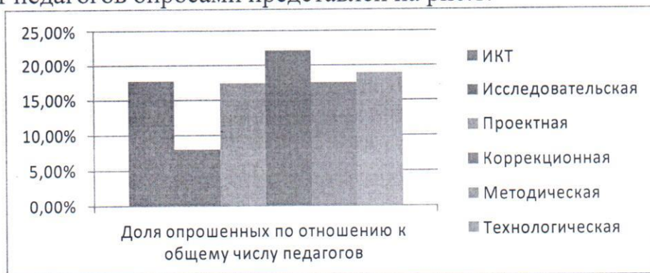
Рис.1 – Доля опрошенных по отношению к общему числу педагогов образовательных организаций Смоленского района

Охват педагогов опросами представлен на рис. 1.