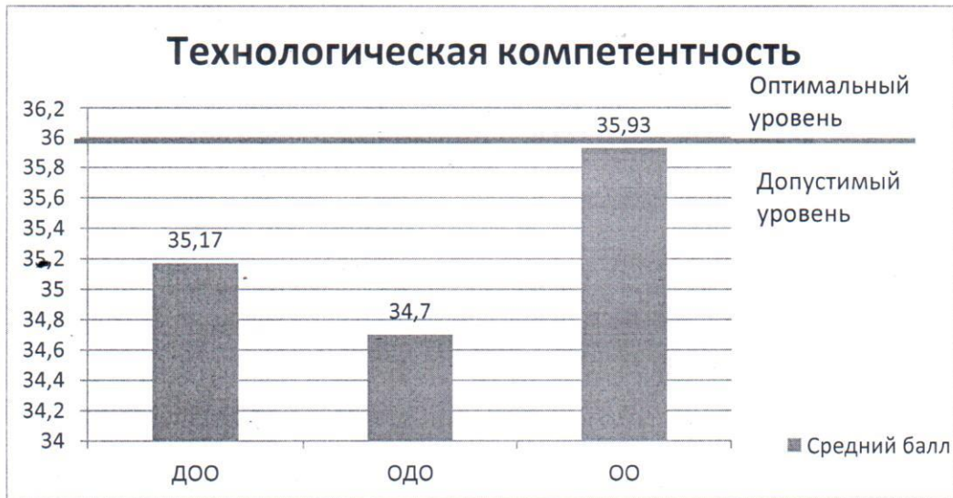
Рис.7 – распределение средних баллов по результатам исследования технологической компетенции