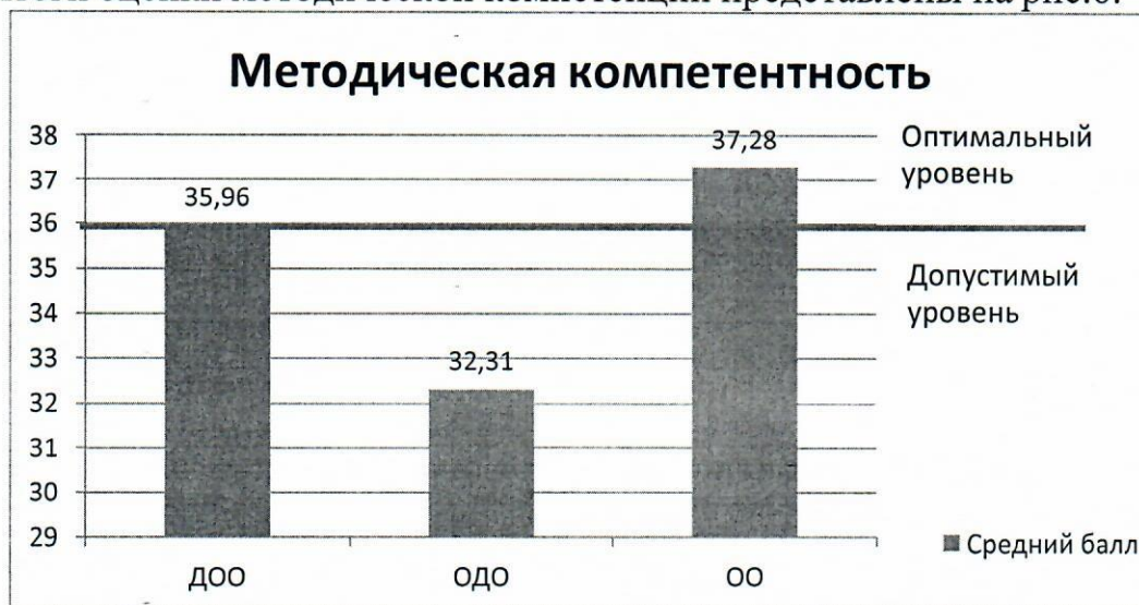
Рис.6 – распределение средних баллов по результатам исследования методической компетенции

Итоги оценки методической компетенции представлены на рис.6.