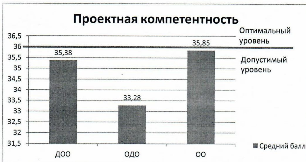
Рис.3 – распределение средних баллов по результатам исследования проектной компетенции

При исследовании коррекционно-развивающей компетенции применялся опросный лист, содержащий следующие вопросы: